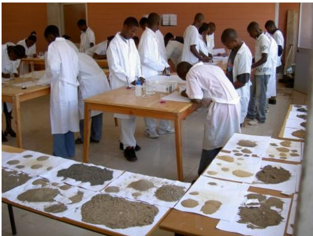
Laboratoř v Kuito