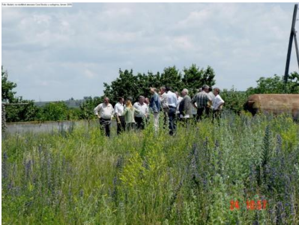
Školení, na návštěvě asociace Cura Bicului, u vodojemu, červen 2005