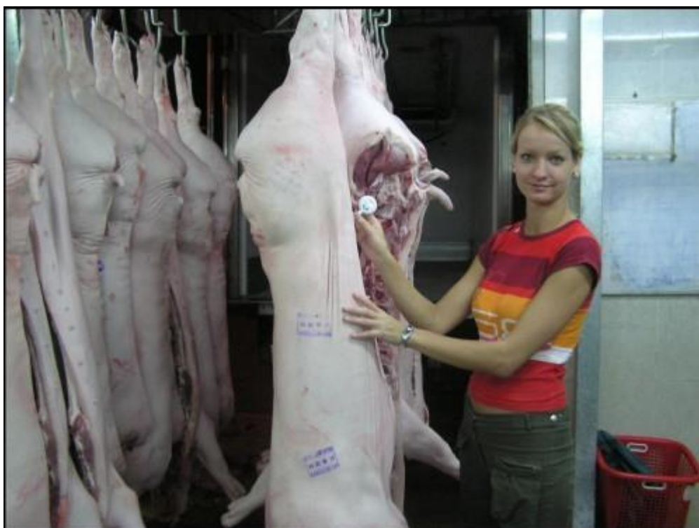
Jatky NAM PHONG - měření pH a teploty masa