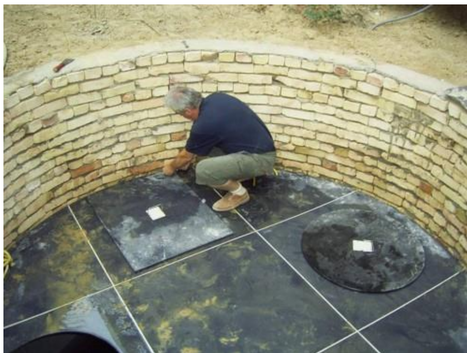
Instalace JOTY 200