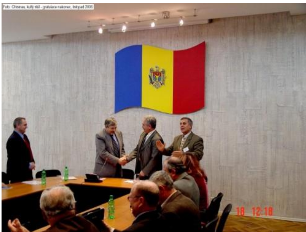
Chisinau, kulatý stůl - gratulace nakonec, listopad 2005