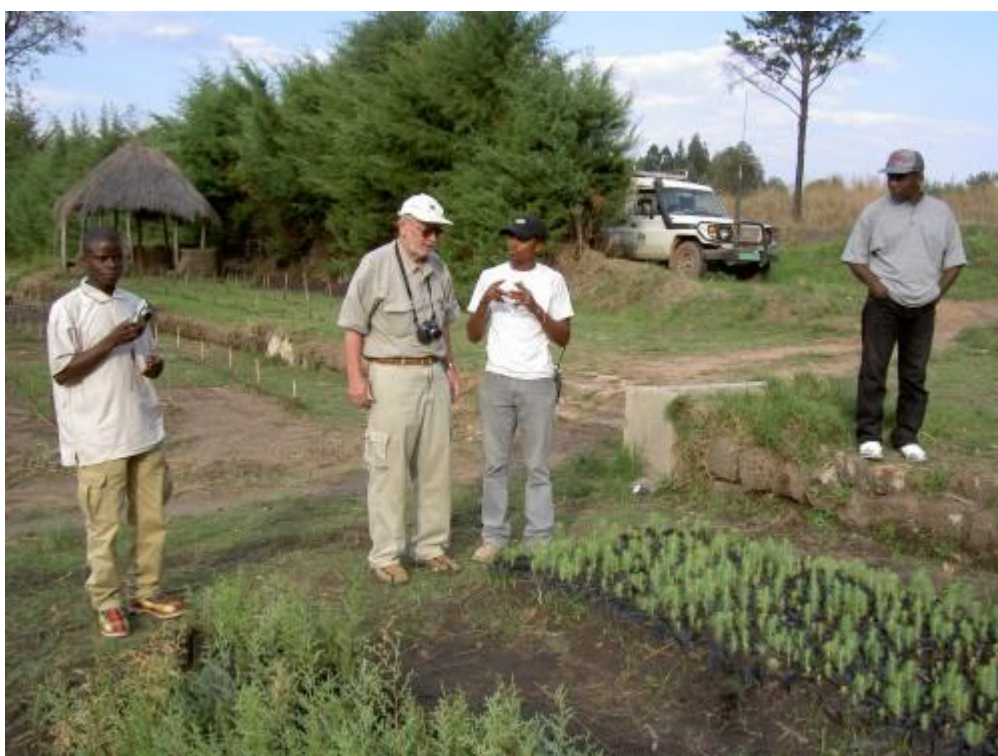
Workshop na téma lesnictví v Angole, Kuito, Bié