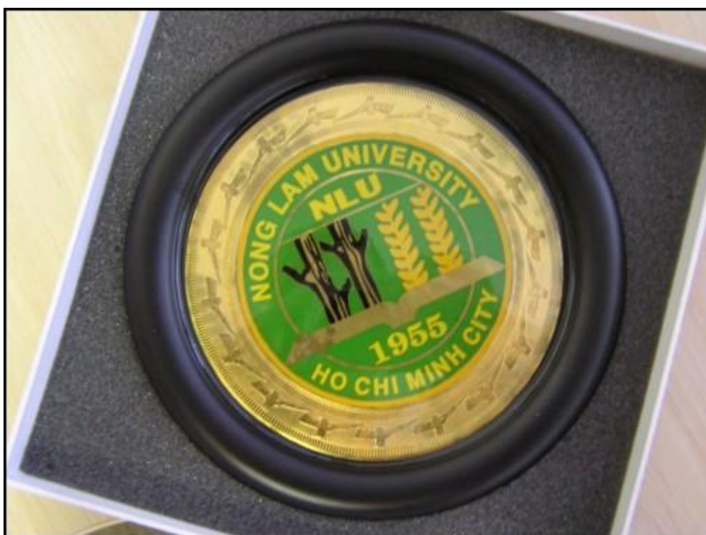
Pamětní medaile Nong Lam univerzity věnovaná ČZU v Praze